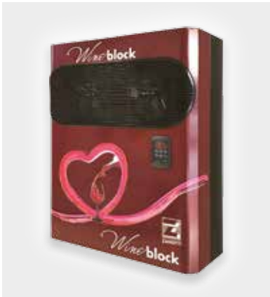
Monobloc Zanotti conçu pour les caves à vin