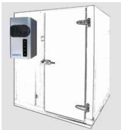
Série GM de Zanotti