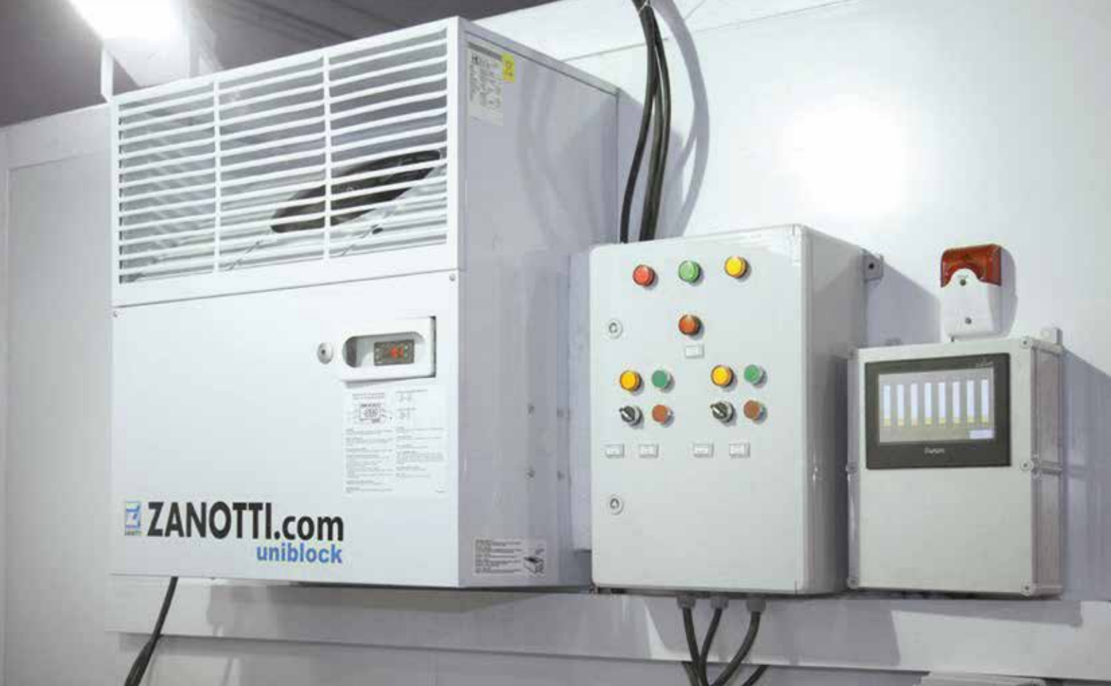
Exemple d'installation de monoblocs Zanotti (chambres froides en location)