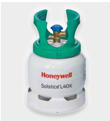
Solstice L40X (R-455A)

Suite aux tests probants du Solstice L40X, Zanotti planifie d'introduire le fluide frigorigène dans ses systèmes monoblocs pour froid positif et examine les opportunités dans les applications à basse température, ainsi que dans le transport réfrigéré.